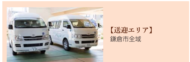
【送迎エリア】 鎌倉市全域