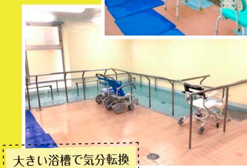
大きい浴槽で気分転換