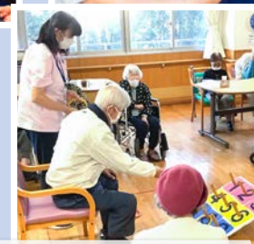
皆さん熱心な集団体操の姿