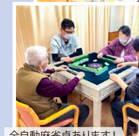
全自動麻雀卓あります!